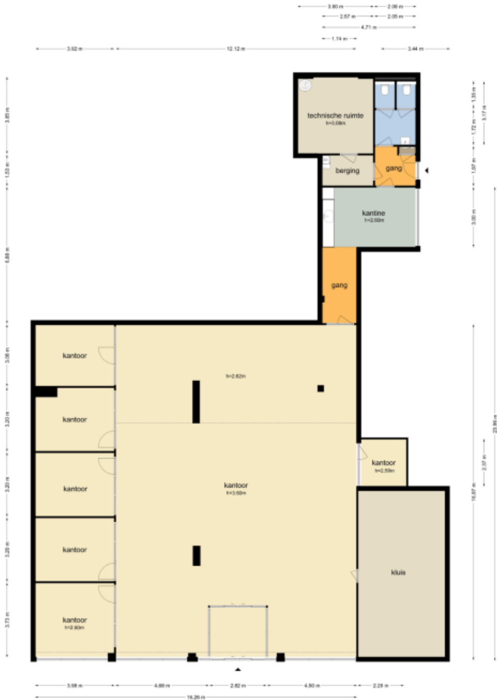
Veerplein 4 - Vloeringen Begane Grond